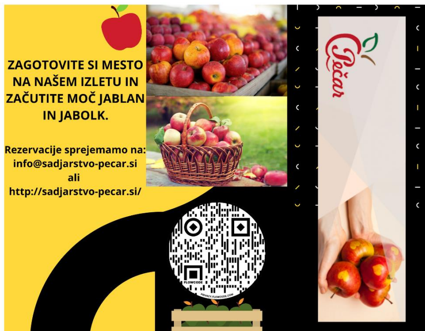
Vir: Lasten vir