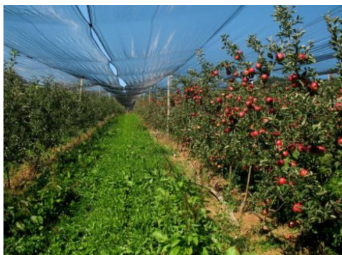
Slika 1: Nasad jablan sadjarske kmetije Pečar