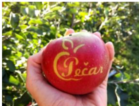
Slika2: Jabolko z logotipom sadjarske kmetije Pečar