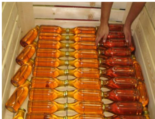
Slika4: Jabolčni sok in jabolčni kis