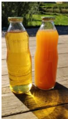
Slika 3: Jabolčni sok (filtriran in nefiltriran)