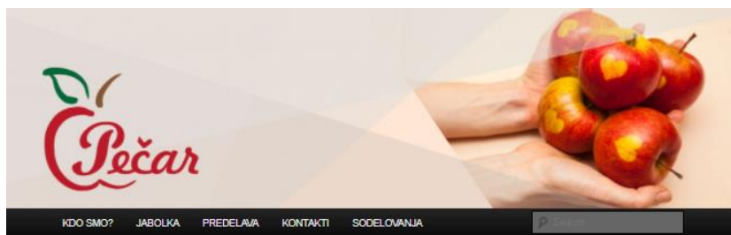
Slika 6: Spletna stran sadjarske kmetije Pečar