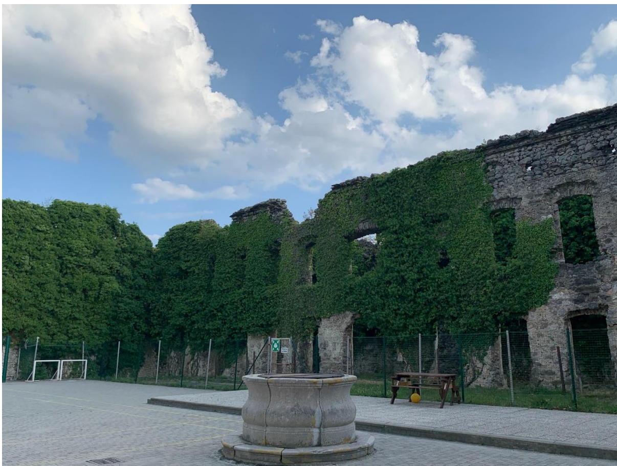
Slika 6 Grad z delom obzidja

Nato smo zavili levo proti vzhodu in si najprej ogledali grad in obzidje. Ker je to drugi najstarejši del vasi, me obzidje, poraščeno z bršljanom, ni presenetilo. Grad je leta 1478 začel zidati grof Leonhard (zadnji goriški grof). Sprva je bil postavljen le obrambni stolp, kasneje pa ga je rodbina grofov Thurnov spremenila v grad. V njem so živeli do leta 1605. Grad je renesančna utrdba, zgrajena po italijanskih renesančnih vzorih, ki se naslanjajo na antiko. Oblikovan je kot nizek renesančni kastel. V času turških vpadov je bil precej poškodovan, zaradi česar so ga kasneje Benečani obnovili. Del gradu je bil domnevno prezidan, saj ima več baročnih značilnosti. Nad portalom je kvadratna vdolbina, kjer je bila včasih reliefna plošča z grbom kriških grofov.