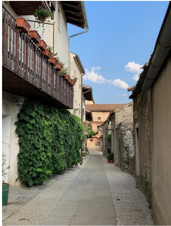
Slika 9 Gase v Vipavskem Križu

Okolica cerkve je urejena in prijetna, saj jo obdajajo drevesa in nizko pokošena trava. Ravno zato smo se tu ustavili in si nekoliko odpočili od hoje po vročem poletnem soncu. S te točke smo imeli lep pogled na okoliške vasi in Čaven.