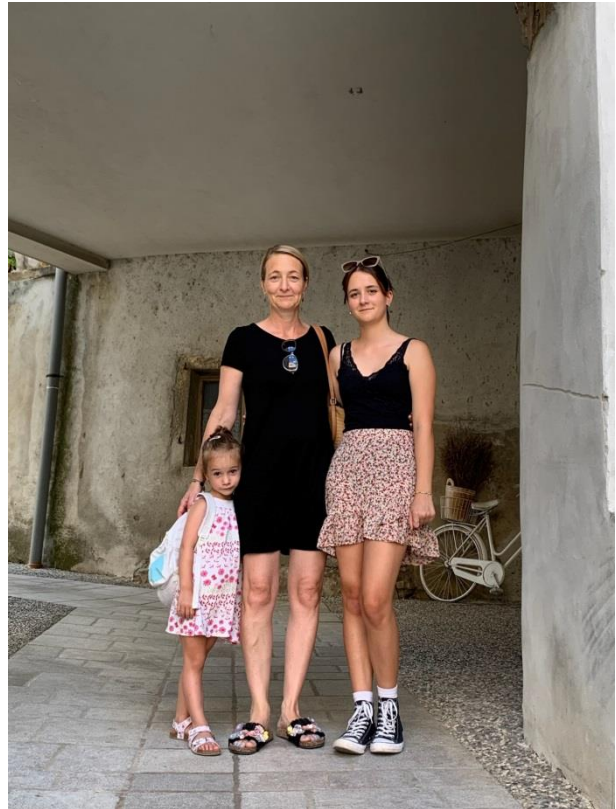
Slika 13 Avtorica z mamo in sestrico

Avtorju knjige sem hvaležna, saj sem Križ lahko spoznala veliko поблиže, kot če bi za podatki brskala le po spletu.