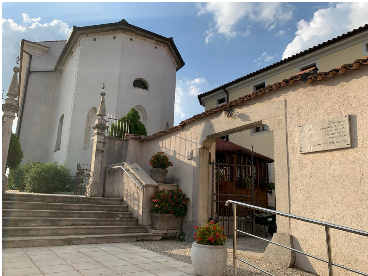
Slika 1 Pogled na cerkev v Vipavskem Križu