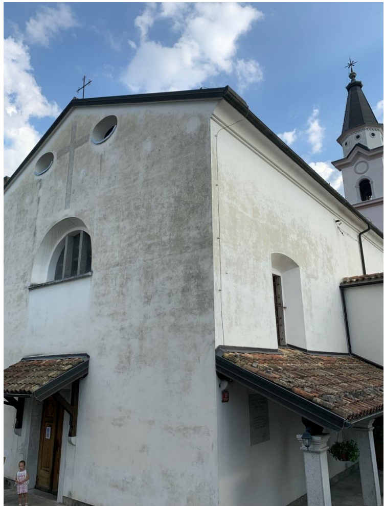
Slika 7 Kapucinski samostan

Samostan je dala zgraditi prej omenjena rodbina Attems, in sicer leta 1636. Na stenah samostana je pritrjena spominska plošča Janezu Svetokriškemu pa tudi lesena tabla bratov kapucinov