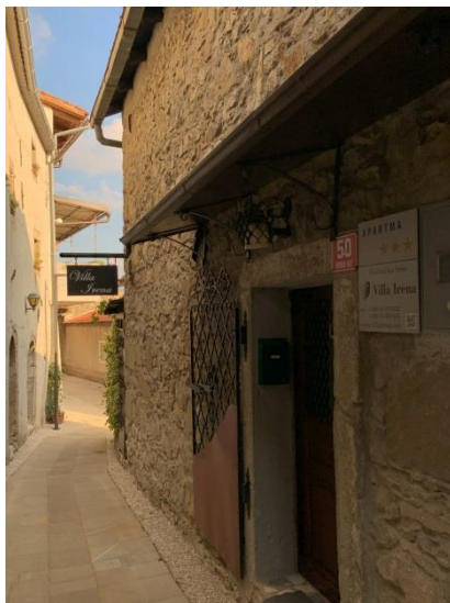
Slika 4 Gase v Vipavskem Križu

Vipavski Križ je naselje, ki se je v zgodovinskem razvoju razvilo v mesto. Prvič je bil Vipavski Križ omenjen v 13. stoletju, ko ga je vojvoda Bernard Koroški 29. 11. 1252 pod imenom Villa Crucis podaril opatiji v Rožacu blizu Čedadu. Na začetku je bil Vipavski Križ prva obrambna utrdba »goriških vrat«. V 15. stoletju je naselje dobilo tržne pravice (natančneje leta 1507) in tako postalo trg. Nato ga je v 16. stoletju, v času turških vpadov, leta 1532 cesar Ferdinand I. Habsburški povzdignil v mesto. Takrat je Vipavski Križ, kot tudi mnoga druga mesta v tem obdobju, dobil obzidje v sklopu protiturške obrambe. Leta 1605 ga je od grofa Henrika Matije Thurn-Valsassina kupil Herman Attems iz rodbine Attems, ki je bila ena najvplivnejših in najpomembnejših na Slovenskem. V 17. in 18. stoletju je življenje v Vipavskem Križu zelo zaživel, nato pa začelo propadati.