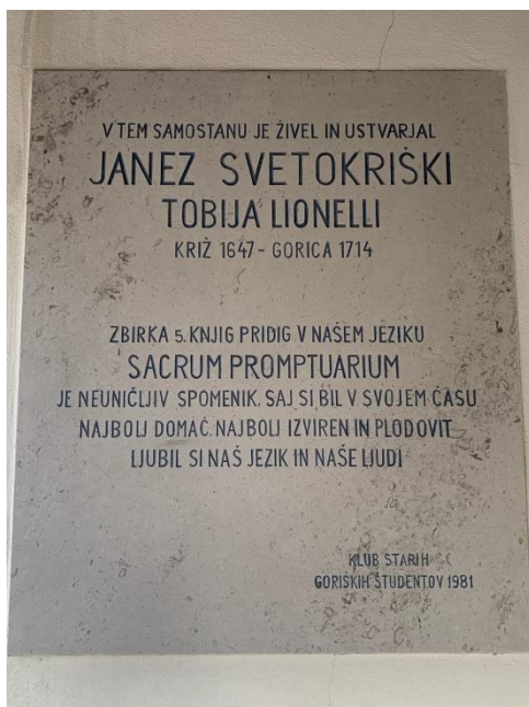
Slika 8 Tabla z napisom "Janez Svetokriški"

Janez Svetokriški je bil slovenski pridigar in književnik. Rodil se je v Vipavskem Križu leta 1647 in tu preživel svoje otroštvo. Že od malega je bil v stiku z očeti kapucini in je zato že zelo zgodaj postal eden izmed njih. V samostanu je živel in ustvarjal; na njegovo nekdanjo prisotnost v tem kraju opozarja njemu posvečen kip pred samostanom. Tu je napisal delo Sacrum Promptuarium oziroma Sveti priročnik , ki obsega kar pet debelih zvezkov.