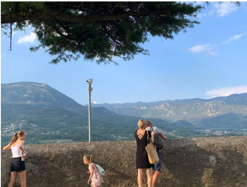
Slika 10 Razgledna točka