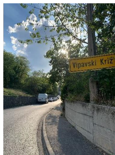
Slika 2 Pot do vasi Vipavski Križ

Za svojo reportažo sem si izbrala Vipavski Križ. To vas smo si z družino želeli ogledati že nekaj časa, letos pa nam jo je končno uspelo obiskati. Zdela se mi je zanimiva in vredna ogleda, saj je ena od najbolj zgodovinsko bogatih vasi v Sloveniji. Vipavski Križ se je zapisal v zgodovino že v obdobju goriških grofov, v času turških vpadov in tudi v Napoleonovi dobi. Sprehodili smo se skozi različne dele vasi in si ogledali marsikatero znamenitost. Obiskali smo jo 26. avgusta 2022, na vroč poletni dan.