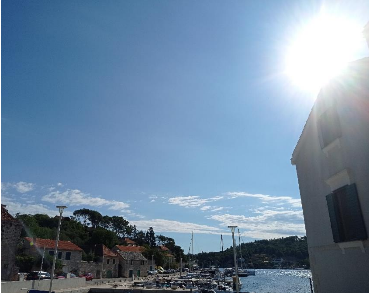
Slika 3 Naselje na otoku

katerimi so bile postavljene vile in razne pogruntavščine moderne arhitekture. Naša pot se je nadaljevala skozi Donjo Krušico, kjer je manjkal le pihljaj vetra, pa bi našemu avtu »odmanjkala« kakšna plast barve. Po ozkih ulicah smo potem prispeli do ozke poti in dolgega, strmega klanca, s katerega se nam je odprl pogled na majhen zaliv in apartma, kjer smo bili nastanjeni naslednjih nekaj dni.