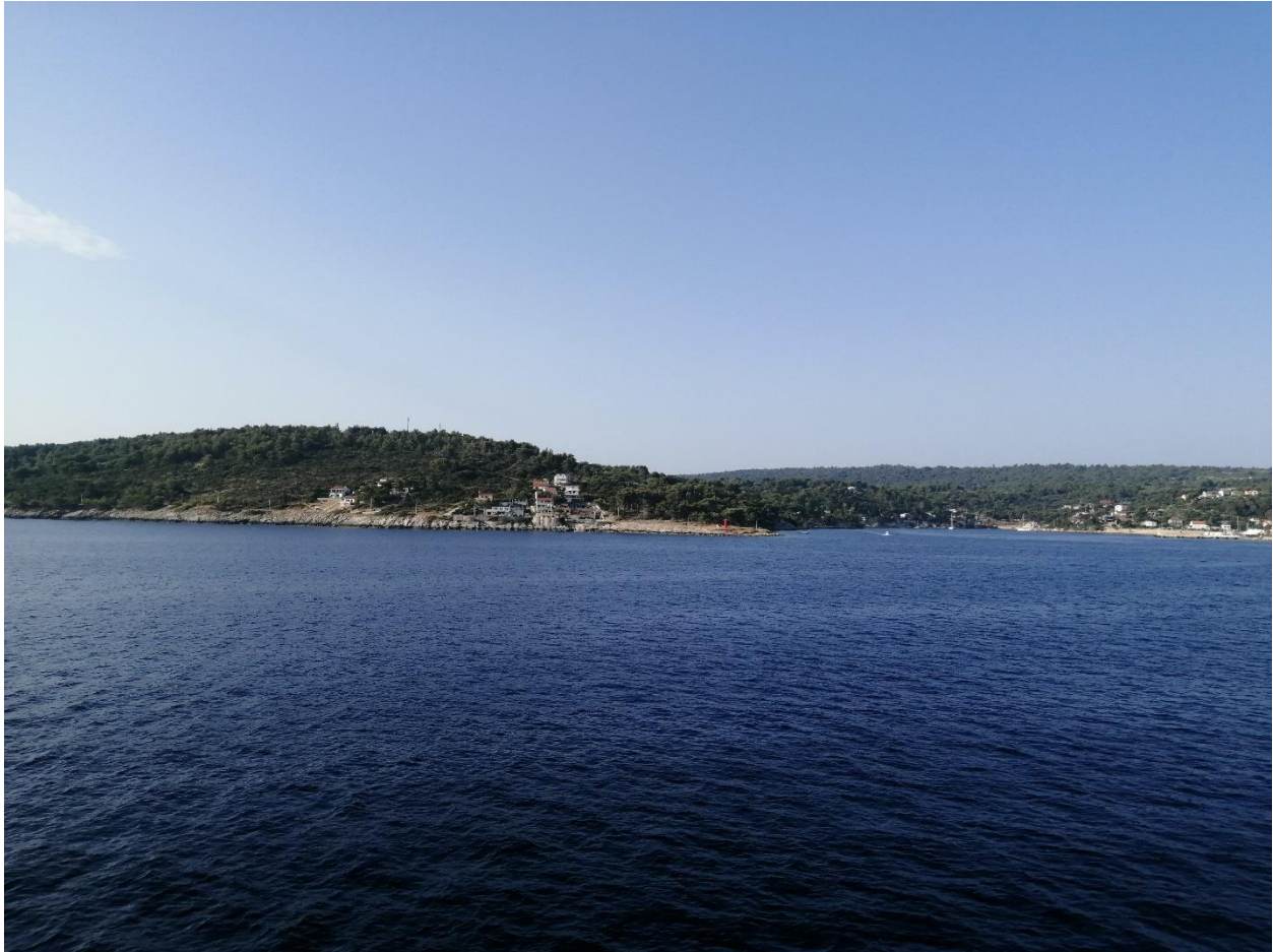
Slika 1 Otok Šolta - pogled s trajekta

Poletni oddih med 5. in 12. julijem 2022 smo z družino preživeli na majhnem otoku Šolta, ki leži nasproti Splita. Tam smo se dodobra namočili v hladni vodi Jadranskega morja in raziskali kratko, a neokrnjeno obalo. Šolta je otok z le 1700 otoškimi prebivalci (od zadnjega štetja leta 2011) in večino te številke predstavlja starejše prebivalstvo. Otok pa postaja tudi zelo zanimiv za Nemce in Čehe, ki kupujejo večje dele obale, kjer gradijo večje, elitne turistične komplekse. Ko sem pisal to reportažo in se poskusil spomniti, koliko časa smo bivali na tem otoku, ne bi nikoli rekel, da je to bilo le osem dni.