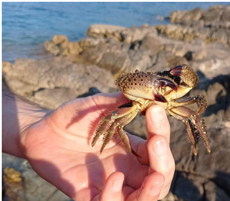
Slika 7 Rakovica

Geografija otoka in njegova flora in favna: »Vedno so rože za tiste, ki jih želijo videti.« (Henri Matisse)