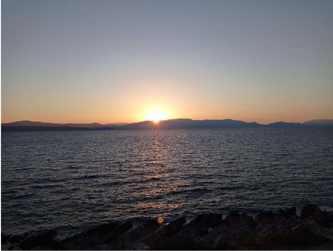
Slika 10 Sončni zahod, slikano z otoka

Vožnja domov je bila dokaj mirna in nezanimiva. Ob prihodu domov sta nas pričakala nona in nono, ki sta čez teden skrbela za naš dom in domače živali. Nona je tudi poskrbela za dobro večerjo. Kot vse druge avanture, dogodivščine in odisejade se je tudi ta končala tako, kot se je začela – s pomirjevalno črnino naših sanj.