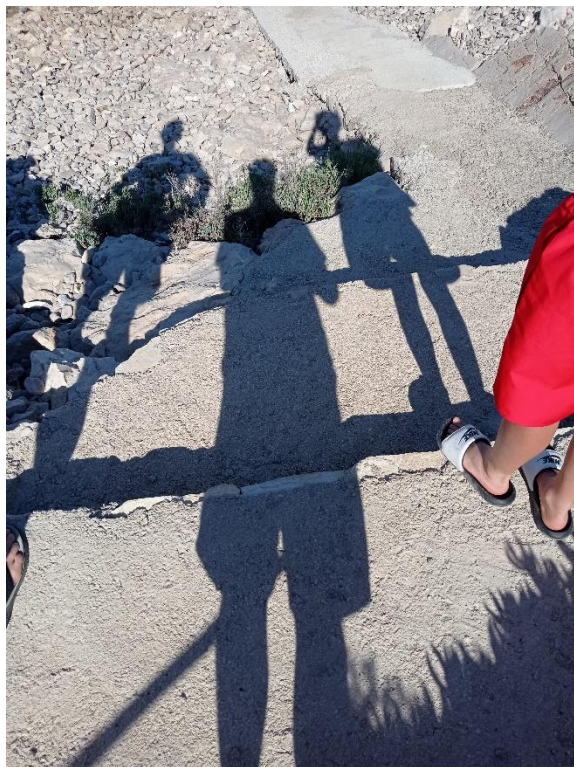
Slika 8 Družinske sence

Geografija otoka in njegova flora in favna: »Vedno so rože za tiste, ki jih želijo videti.« (Henri Matisse)