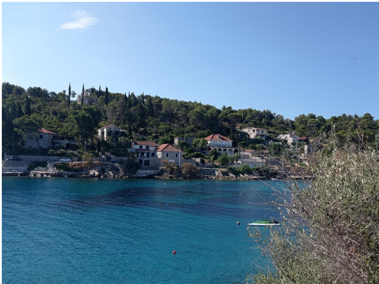
Slika 9 Rogač

Celoten 12. julij: »Ne obstaja ne konec, ne začetek, le strast življenja.« (Federico Fellini)