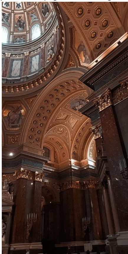
Slika 7 Notranjost bazilike

V notranjosti me je prevzela njena mogočnost, visoki stebri, okrasje in številni veliki oltarji. V ceno vstopnice je bil všteti tudi panoramski pogled z vrha enega od treh zvonikov oz. višine 96