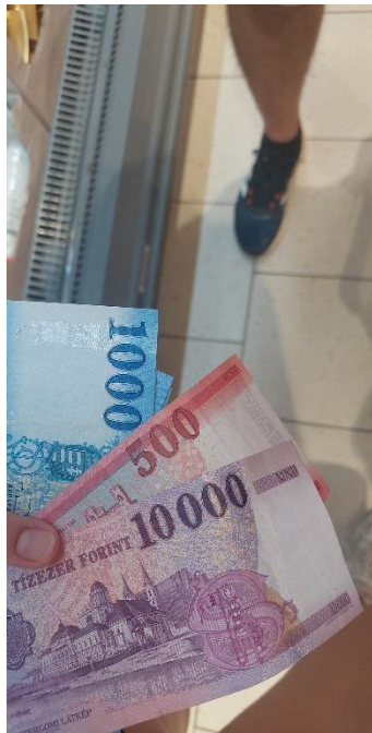
Slika 2 Madžarski forint

zdele podobne slovenskim. Sodeč po tem, kar sem uspela videti, ko nisem spala. Po nekaj urah počitka/vožnje in gledanja skozi okno, smo končno prispeli na prvo destinacijo. Ko sem izstopila iz avtomobila, me je najprej zadel temperaturni šok, saj je bilo zunaj zelo soparno in vroče, notri pa prijetno hladno zaradi klime.