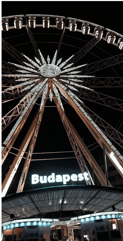
Slika 5 Razgledno kolo ponoči

Ko smo se prebili skozi popoldansko gnečo glavnega mesta Madžarske, smo v ulici blizu središča mesta s pomočjo navigacije našli naš hotel. Avtomobil smo parkirali v parkirno hišo pod njim in se povzpeli po stopnicah dve nadstropji navzgor v recepcijo. Tam smo počakali v vrsti za prijavo, izpolnili obrazce in se napotili v sobo. Sicer smo navajeni dvosobnih apartmajev ali hotelskih sob, tokrat pa smo si sobo delili vsi štirje. Kar nam je ponoči povzročalo veliko preglavic, saj je bilo očetovo smrčanje neznosno. Razpakirali smo se in se brez zavlačevanja odpravili ven, da bi lahko ujeli čim več utrinkov mesta.