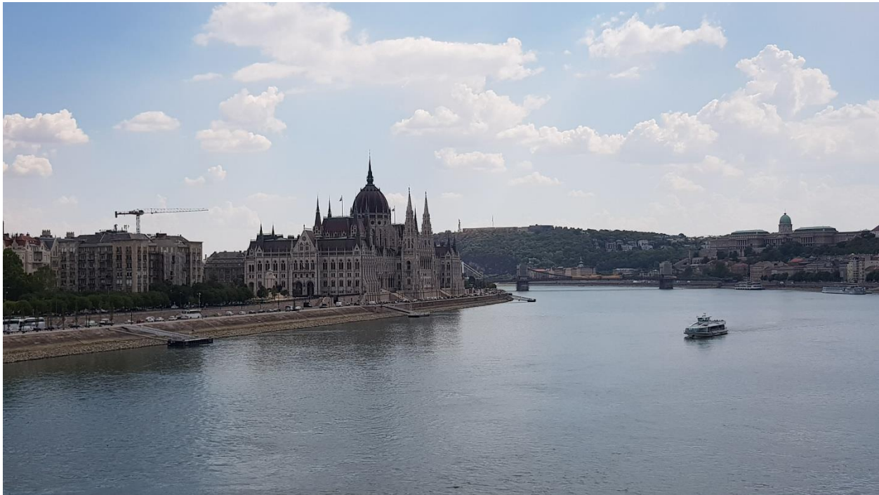
Slika 8 Madžarski parlament ob Donavi

Najznamenitejša stavba v Budimpešti je gotovo dih jemajoč parlament. Je največja zgradba v mestu in ena največjih parlamentarnih zgradb na svetu. Njegova površina znaša skoraj 18 tisoč kvadratnih metrov. Gradili so ga zgolj madžarski obrtniki in to iz domačih surovin. Edini gradbeni element, ki so ga uvozili, je osem ogromnih granitnih srebrov. Takih je na svetu le dvanajst, od tega so štirje še v Veliki Britaniji. Rdeča preproga, ki se razprostira po notranjosti stavbe, je dolga tri kilometre; z zunanje strani pa lahko naštejemo 365 majhnih stolpov – vsak predstavlja en dan v letu. Za člane Evropske unije sta voden ogled in vstop v parlament brezplačna. Greh je pa bil, da si parlamenta nismo ogledali od znotraj. To pa zato, ker je za ogled potrebna rezervacija in tudi kolona ljudi, ki je čakala na ogled tega arhitekturnega velikana, je bila skladna z njegovo velikostjo, torej ogromna. Zato smo se sedli v senco pred zgradbo in še nekaj časa z navdušenjem opazovali monumentalnost te zgradbe.