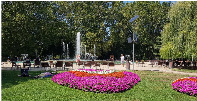
Slika 9 Glasbeni vodnjak na Margaretinem otoku

Pot smo nato nadaljevali po glavni ulici čez most nad reko Donavo. Mosta pa nismo prečkali v celoti, saj smo z njega zavili na Margaretin otok. Ta se nahaja se na reki Donavi med Budimom in Pešto, nekdanj ločenima mestoma, sedaj pa združenima v Budimpešto. Otok je pravi zeleni biser mesta. Prepreden je s številnimi parki, na njem so zdravilišče, tekaške in kolesarske