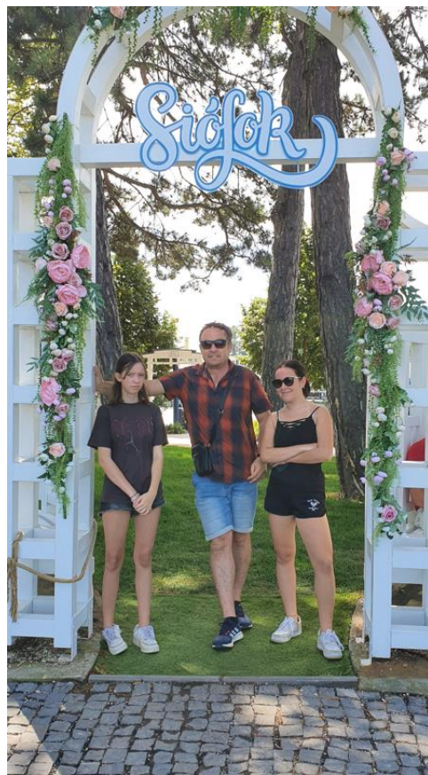
Slika 3 "Prisilno" fotografiranje v Siófoku

Siófok že 150 let velja za najpomembnejše turistično mesto ob Balatonu (madžarsko poimenovanje za Blatno jezero). Bolj kot smo se približevali obali jezera, bolj smo spoznavali, da je to res. Prikupno staro mestno središče se namreč kmalu prelevi v kompleks hotelov, apartmajskih hiš, restavracij in trgovinic.