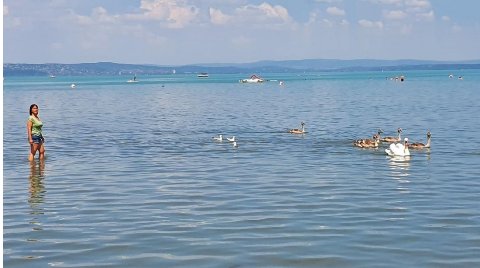
Slika 4 Mama v Blatnem jezeru

je že prej ohlajalo nekaj domačinov. Prehodila je približno 50 metrov, pa ji je voda še vedno segala komaj do kolen. Blatno jezero imajo Madžari za nekakšno svoje morje. Obsega namreč 592 kvadratnih kilometrov, ob njem je veliko turističnih naselij, radi pa ga izkoristijo tudi za vožnjo z različnimi plovili.