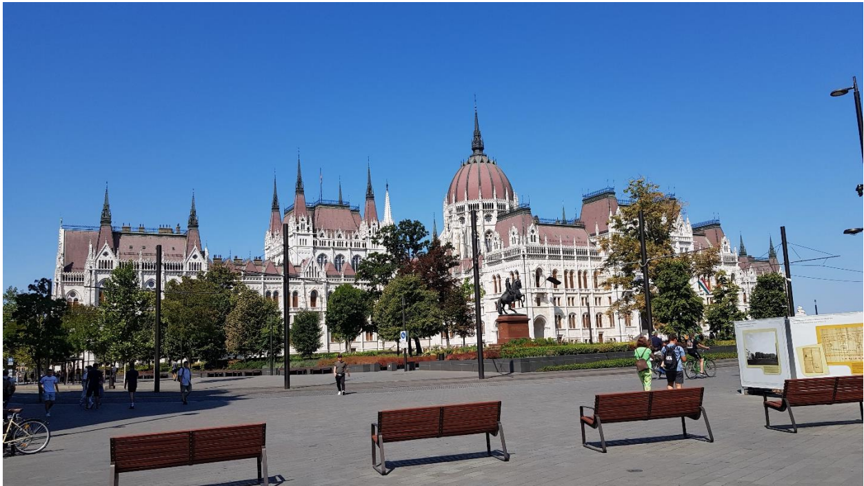
Slika 1 Madžarski parlament v Budimpešti

Narava? Gore? Velika mesta? Slovenija? Tujina? Dilem je bilo veliko. V družini imamo navado, da se poleg poletnega dopusta na morju med poletnimi počitnicami odpravimo še kam drugam. Vsako leto izbiramo med različnimi destinacijami. Prav nič drugače ni bilo v lanskem avgustu. Destinacijo je na koncu po naključju izbral oče. S sestro sva namreč želeli obiskati kakšno večje mesto, mati in oče pa sta si želela bolj sproščenega oddiha v naravi. Tako smo združili mestni vrvež Budimpešte in občudovanje pokrajine ob Blatnem jezeru.